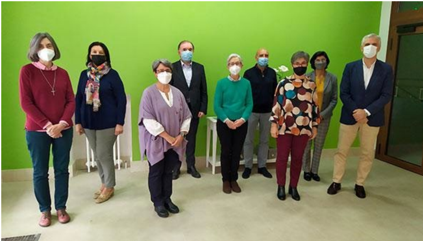
Patronato de la Fundación Escuela Teresiana